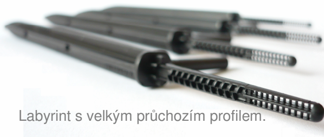
Labyrint s velkým průchozím profilem.

Velká plocha filtru na vstupu do kapkovače pro zajištění spolehlivé činnosti i při horší kvalitě vody.